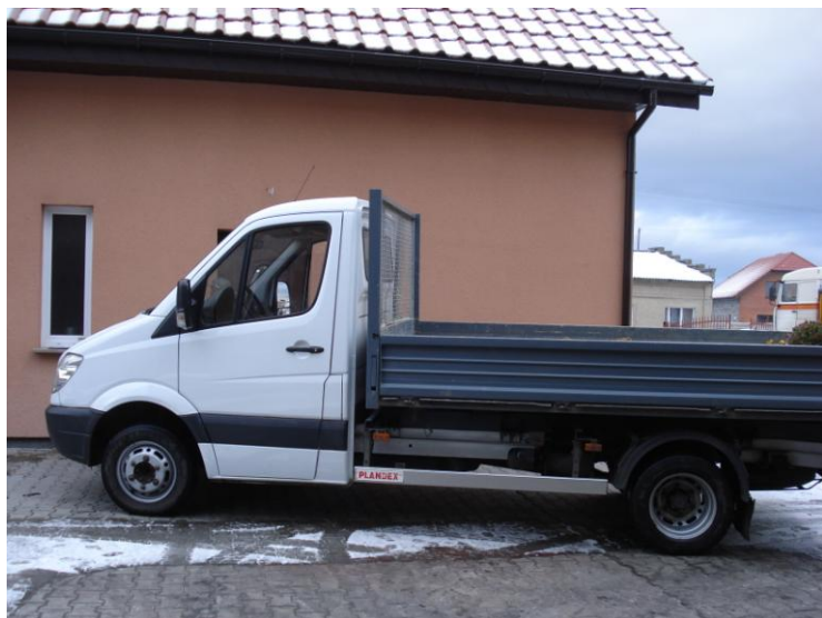
Fot. 3. Samochód dostawczy zakupiony przy wykorzystaniu środków unijnych

Koszt wszystkich elementów przedsięwzięcia określono na około 240 000 zł netto, czyli 300 000 zł brutto i tyle wyniósł po jego realizacji. Dla sfinansowania projektu konieczne