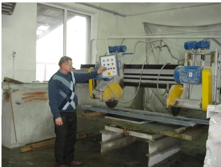
Fot. 2. Piła formatowa do cięcia kamienia to początek nowych technologii wdrażanych w firmie

wierzchnią produkcyjną zakładu. Właściciel rozpoczął starania o pozyskanie nowego terenu