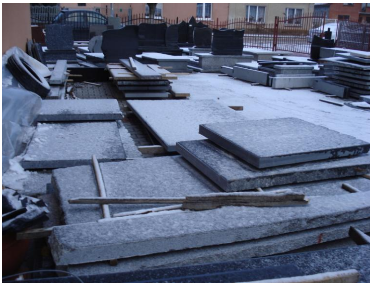
Fot. 4 Materiały do produkcji i wyroby gotowe na placu utwardzonym przy pomocy unijnej

Dzisiaj obsługa piły nie stanowi żadnego problemu. Zakup ten przełożył się na ułatwienie produkcji nagrobków, podniesienie jakości ich wykonania oraz zwiększenie produkcji. Samochód dostawczy poprawił logistykę w firmie. Z perspektywy czasu sama realizacja operacji pod kątem organizacji i przebiegu prac modernizacyjno-budowlanych oraz montaż piły i zakup samochodu dostawczego nie sprawiły żadnych problemów. Podobnie, płynność finansowa firmy została zachowana. Jako trudności w realizacji projektu zapamiętano konieczność dokonywania zbyt wielu uzupełnień i wyjaśnień na etapie składania wniosku o pomoc i później wniosku o płatność. Ten fakt postrzegany jest przez przedsiębiorcę jako zbyt