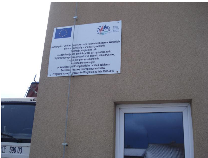
Fot 5. Budynek zakładu po wykonaniu ocieplenia i tynku zewnętrzznego

ju. Realizacja przedsięwzięcia spowodowała, że usługi świadczone przez firmę Pana Tadeusza Lewicza stały się konkurencyjne.