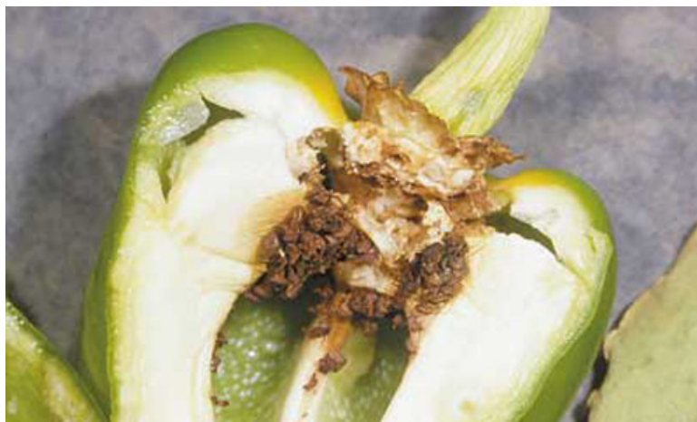
Ryc. 2. Otworki wygryzione przez Anthonomus eugenii w owocach papryki (po lewej, fot. D. Schuster, University of Florida, USA) i uszkodzenia wewnętrzne spowodowane przez larwy w miąższu owocu papryki (po prawej; fot. J. L. Capinera, University of Florida, USA).