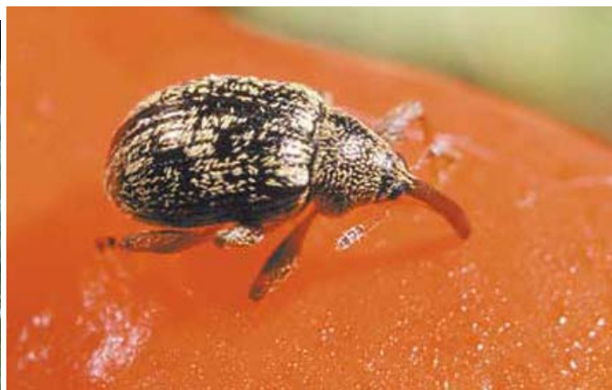
Ryc. 1. Anthonomus eugenii - larwa w miąższu owocu papryki (po lewej) i chrząszcz (po prawej).